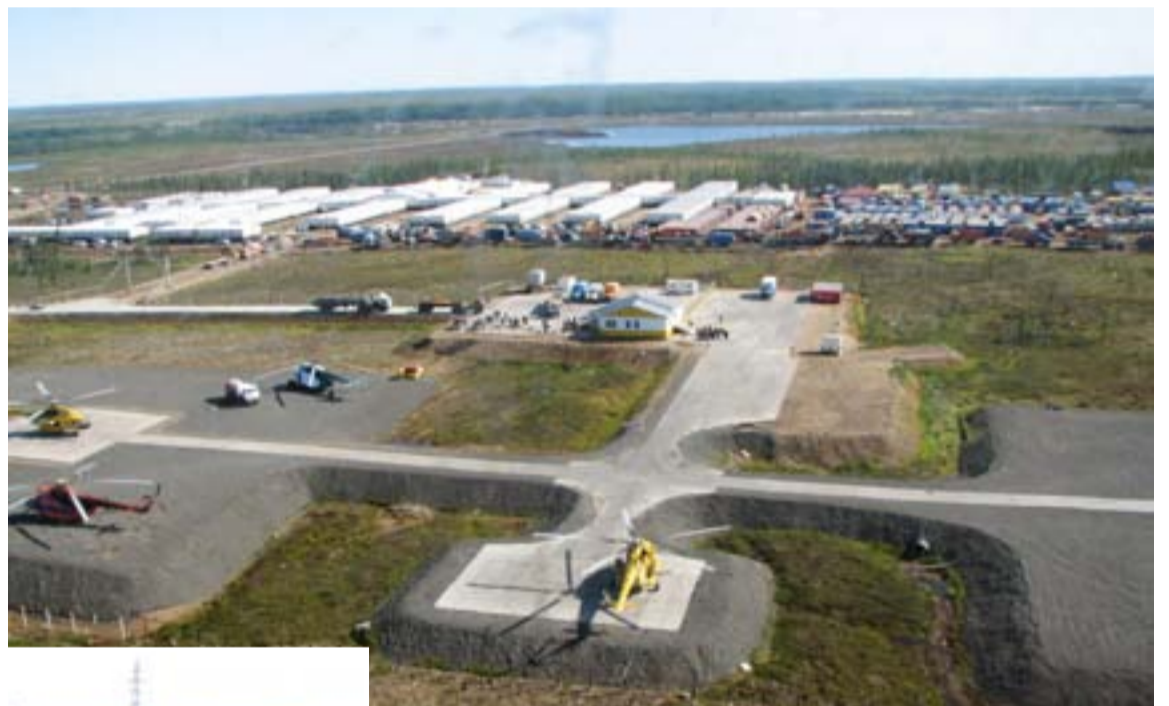
Вертолетная площадка построена с применением современных щадящих методов, на заднем плане — КЭМП-1200, современный модульный городок-общежитие.