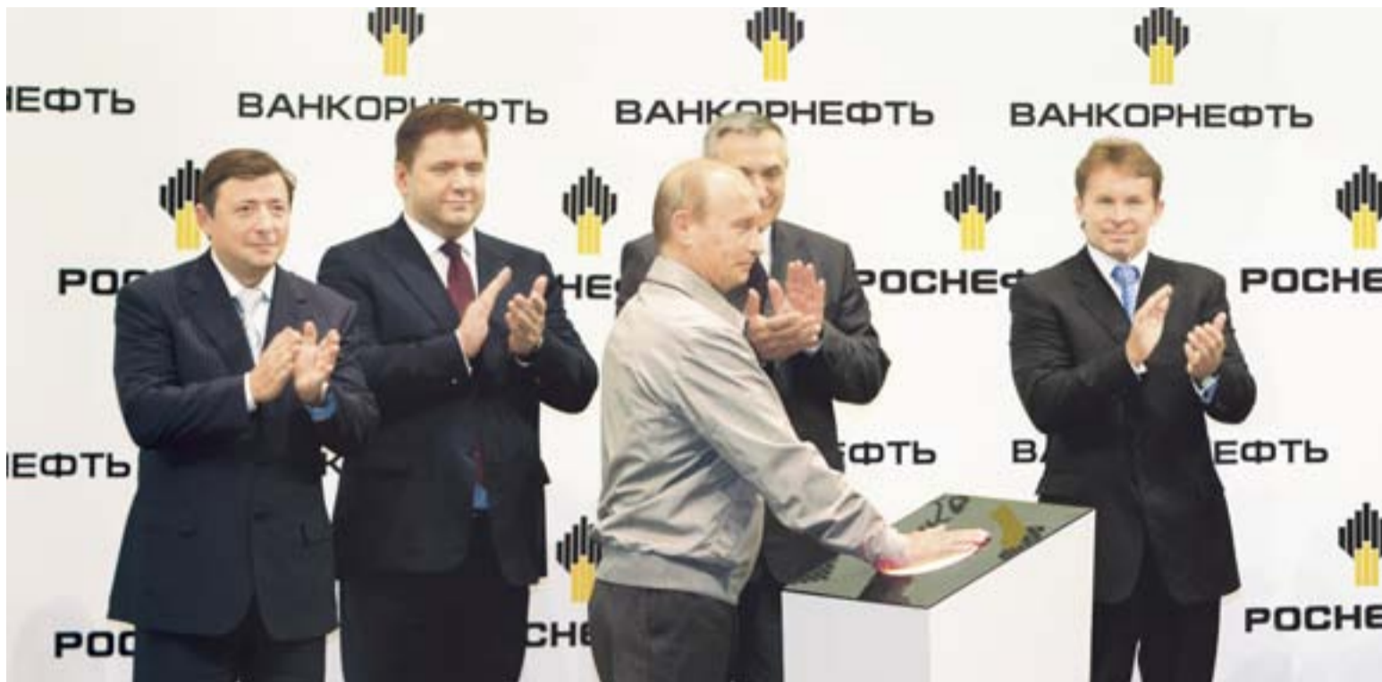
Старт промышленной эксплуатации нового крупного месторождения дал глава Правительства РФ Владимир Путин.

И как раз первое, на что обращаешь внимание, прилетев