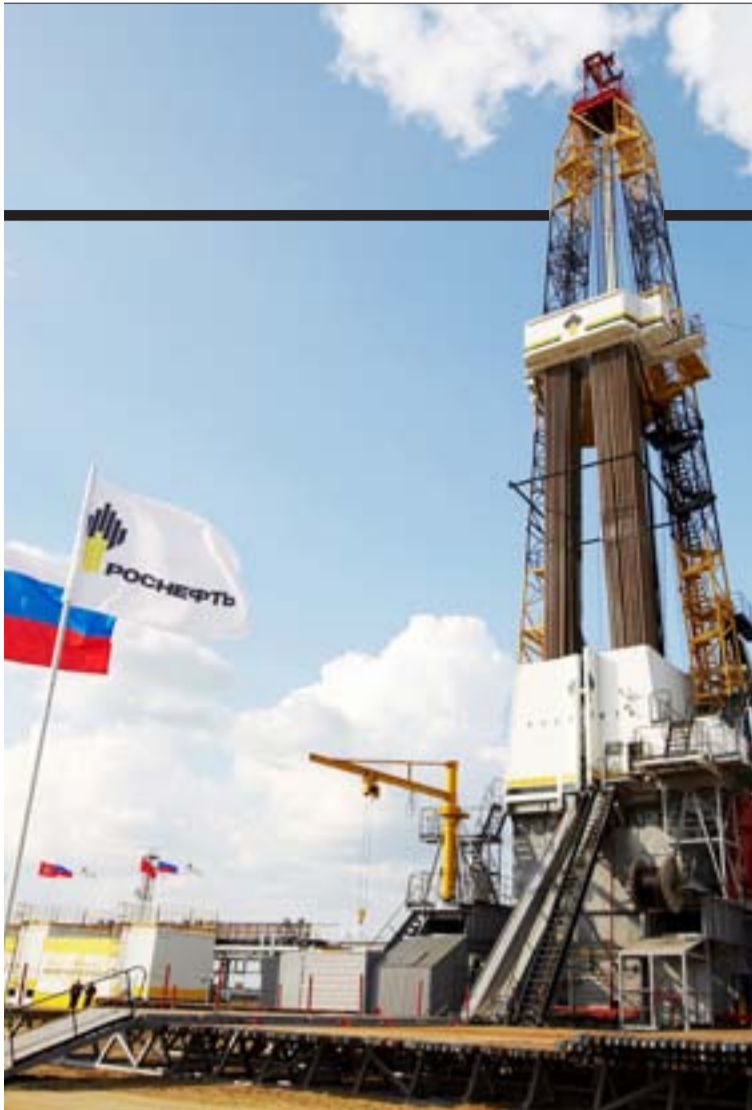
21 августа 2009 года. Запуск Ванкорского месторождения.

ми корпусами. В зимние 60-градусные морозы, когда сутробы наметает по два с лишним метра, передвижение по комфортабельному теплему КЭМПУ — истинное удовольствие. Здесь в комфортабельных условиях современного типового жилья со всеми удобствами живут около полутора тысяч вахтовиков — нефтяников и строителей из подрядных организаций. На столько же человек рассчитан и недавно пущенный в строй новый трехэтажный административно-бытовой комплекс повышенной комфортности. Всего же на Ванкоре работает около 12 тысяч человек из 450 подрядных организаций — вахтовым методом, месяц через месяц по 8—12 часов в сутки в три смены с перерывами на отдых и обед. На Ванкоре абсолютный сухой закон, который опровергает устоявшееся мнение, что русский человек без спиртного работать не может. Когда, возвращаясь с Ванкора, я поинтересовался у летевших со мной вахтовым самолетом буровиков, не соскучились ли по рюмочке, один из моих собеседников признался, что пива по прилету с удовольствием выпьет, но вот на вахте, не то, что не тянуло, некогда и думать об этом было. «Там работать нужно. За тем и едем!»