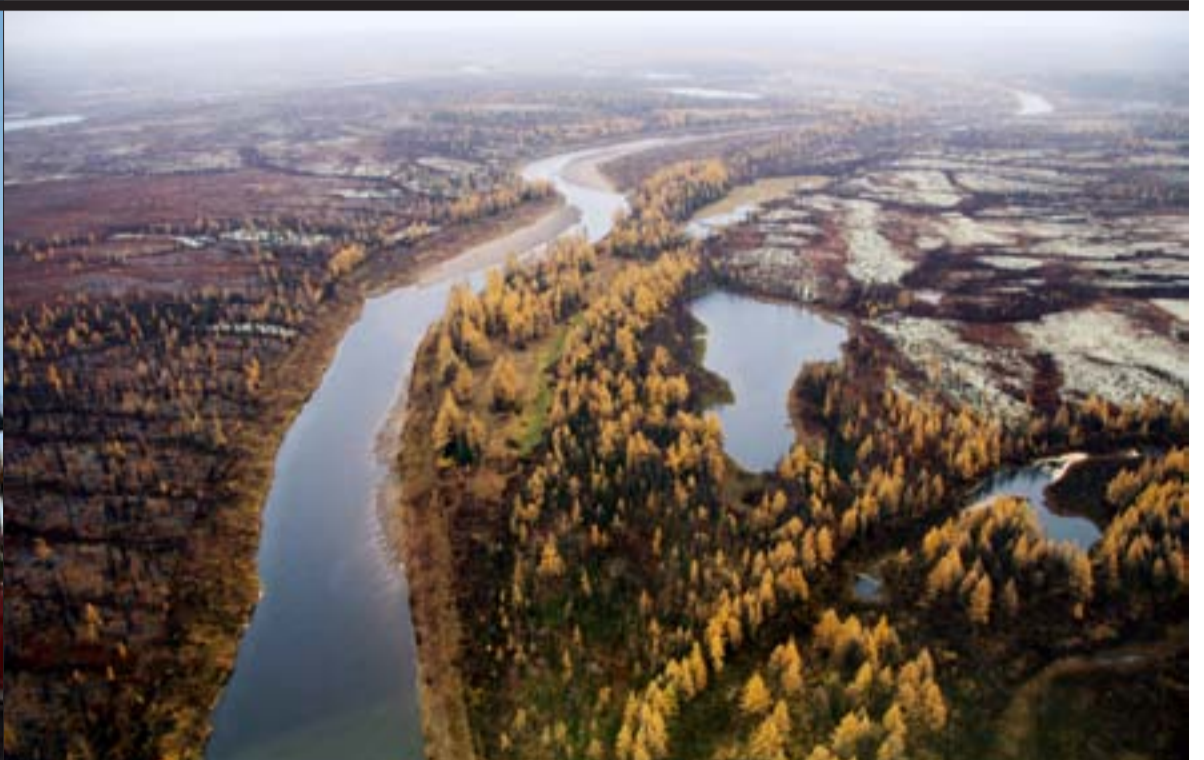
Благодаря природоохранным усилиям Роснефти этот уголок нетронутой природы сохранит свою первозданность.

Роснефть построила в Игарке современный аэровокзал с гостиничным комплексом, столовыми, просторными залами ожидания, оснащенный всеми новейшими аэронавигационными комплексами. В ближайший год на средства нефтяной компании будет реконструирована взлетно-посадочная полоса, с тем, чтобы аэропорт мог