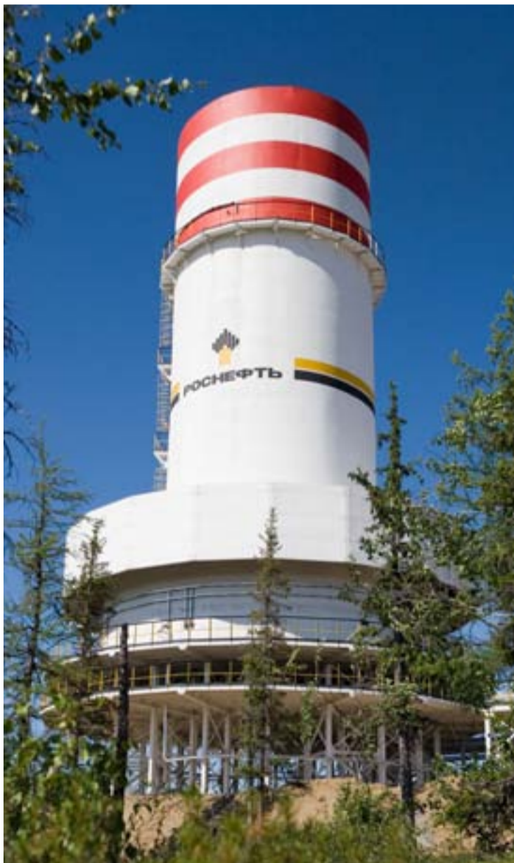
Установка бездымной утилизации (сжигания) попутного нефтяного газа